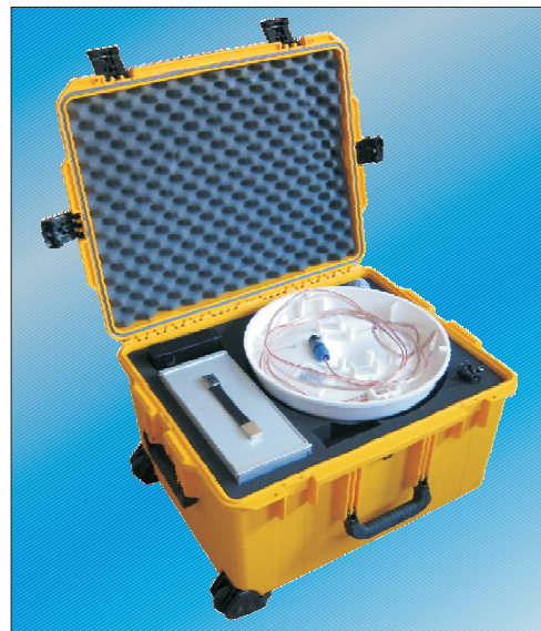
Obr.: MobilHorn v transportním kufru.

Konstrukce: vysoce odolný, vodotěsný Rozměry: 625 x 500 x 366 mm